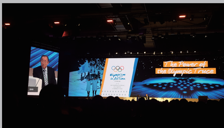
圖 1 聯合國前秘書長潘基文

重點內容： 奧林匹克停戰的傳統主要在乎籲各國保證在奧運會舉辦期間能讓所有的運動員及觀眾通行安全無阻。即使在許多艱困的戰亂情況下，奧林匹克停戰的訴求仍然配合 3000 年前古希臘所闡揚的理念並依據奧林匹克所提倡的幾個核心價值如和平、團結與尊重來加以推動。最近韓國平昌的冬季奧運會運作兩韓組隊成功是推動奧林匹克主義價值實踐的重要里程碑。大會特別邀請聯合國前秘書長潘基文前來見證說明此一成功的典範。或許值得兩岸參考借鏡。