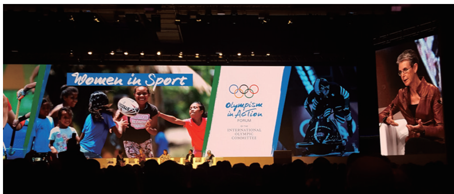
圖 2 男女平權與性別平等為普世價值，在運動的世界也不應例外

重點內容： 過去百年來女性參與運動的比例已有很大的進展，男女平權與性別平等為當今普世性的主流價值。也是聯合國永續經營發展的主要推動目標。主辦單位特別邀請幾位推動性別平權有成就的專家來分享個人經驗與見解。