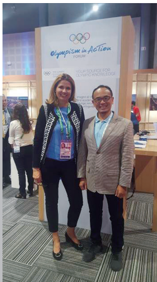
圖 9 與國際奧會奧林匹克中心主任及教育主管合影