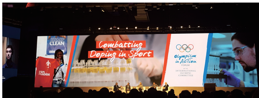
圖 3 運動禁藥議題關係到體壇的未來

重點內容： 奧林匹克活動及全世界的各種組織目前皆有責任確保體育運動比賽及其環境皆應公平且乾淨。我們要如何確保藥檢的獨立性且不會受到利益衝突？我們要如何打破“沉默法則”並鼓勵更多人勇於站出舉發違規的情事？如何在打擊運動禁藥的過程中去維持運動員的公民權利與個人隱私的平衡？本場次討論邀請不同背景的運動員及官方人員來討論與運動禁藥相關最具批判性的議題，因為此議題將會影響整個奧林匹克活動及世界體壇的未來發展。