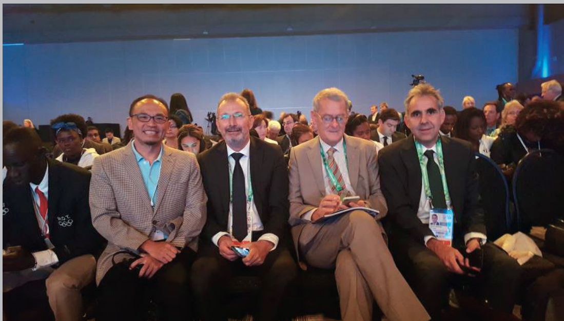
圖 6 與國際奧林匹克學院教務長及德國科隆體育大學奧研中心主任合影

網建立機會等。這些討論出來觀點與經驗分享將有助於改變未來的運動。此次，筆者有幸代表臺灣奧林匹克教育學者參與此一盛會並適時與許多專家學者互動，突破我對外交流的能見度，尤其能夠親自見到國際奧會奧林匹克研究中心主任與教育主管、國際奧林匹克學院教務長。他們都非常支持臺灣成立奧林匹克博物館及奧林匹克研究中心，並對臺灣體育運動大學將奧林匹克教育列為大學博雅教育中的必修課程讚譽有佳，若能向下扎根將正向的奧林匹克價值教育推動到各級中小學，並結合青少年學生運動員的品格或態度教育，則會更完善。透過參與此論壇，也讓筆者多加了解未來我國奧林匹克研究主題的趨勢，相信以上這些資訊將有助於對我國國家體育政策的發展。